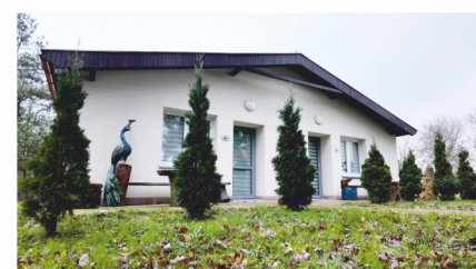
Domki na wynajem w Bieszkowicach