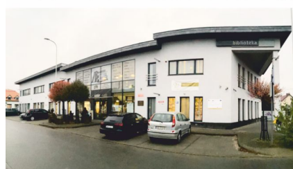
Filia w Bolszewie