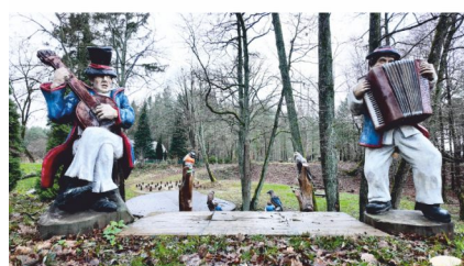
Teren rekreacyjny w Bieszkowicach