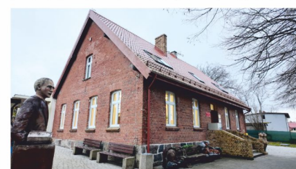
Filia w Bieszkowicach