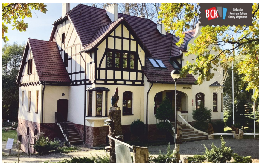
Dworek Drzewiarza w Gościnnie – siedziba główna Biblioteki i Centrum Kultury Gminy Wejherowo

BCK to także miejsce, w którym rozwijają się lokalne talenty muzyczne. Mamy aż cztery sekcje artystyczne: Orkiestrę Dętą Gminy Wejherowo, Chór Gaudeamus, Zespół Na Dobrą Nutę oraz Kapelę Kaszubską Zbierańce.